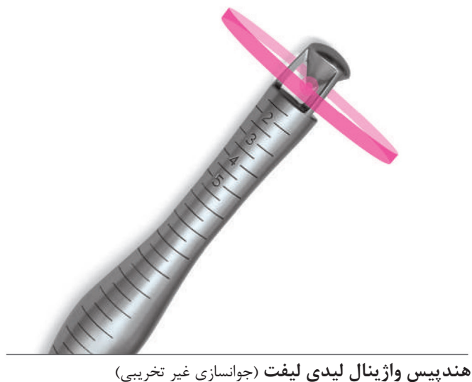
هندپیس واژینال لیدی لیفت (جوانسازی غیر تخریبی)